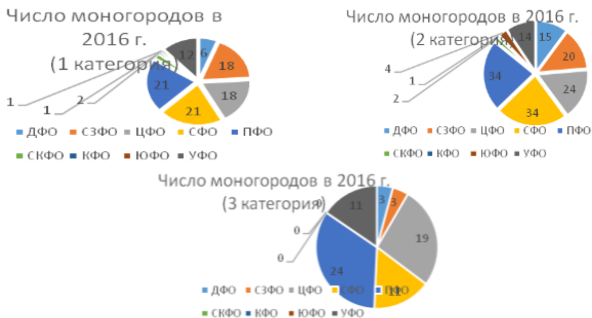
Рис. 3. Число моногородов по категориям в разрезе по федеральным округам за 2016 г.

Как представлено на диаграммах, в 2016 г. основная часть моногородов была сосредоточена в ПФО, СФО и ЦФО. Так, число моногородов 1 категории в ПФО составило 21 ед., в СФО – 21 ед., ЦФО – 18 ед., 2 категории – 34, 34 и 24 ед., 3 категории – 11, 24 и 19 ед.