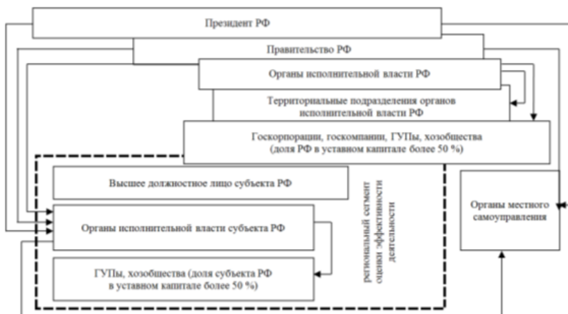
Рис. 4. Оценка эффективности управленческой деятельности в современной системе государственного управления

Проведенные авторами исследования позволяют сделать вывод о значимой роли оценки эффективности управленческой деятельности в современной системе государственного управления (рис. 4).