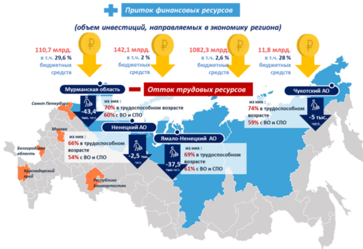
Рис. 1. Схема, отражающая разнонаправленность потоков основных видов ресурсов инвестиционной деятельности, в разрезе регионов АЗ РФ, 2017 год.

на первый план выходит необходимость обеспечения реализации инвестиционных проектов трудовыми ресурсами. В данном контексте, придерживаясь сформулированной автором расширенной трактовки термина «инвестиционные ресурсы региона», можно утверждать, что трудовые ресурсы являются доминирующим ресурсом инвестиционной деятельности в арктических регионах.