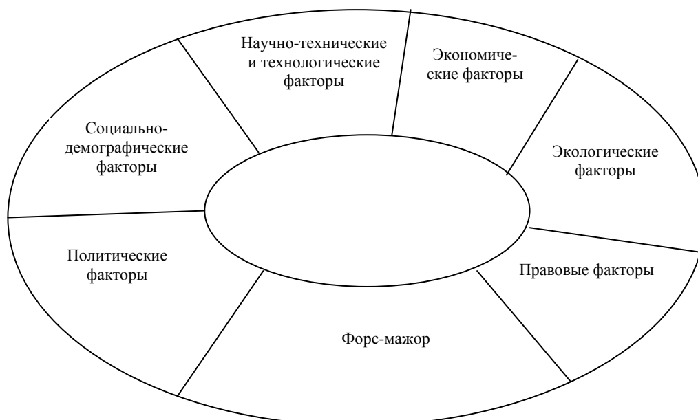
Рис. 2. Факторы угроз внешней среды

Представим факторы угроз внешней среды на рис. 2.