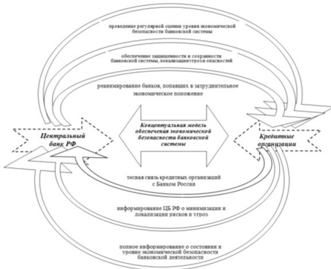
Рис. 1. Концептуальная модель обеспечения экономической безопасности банковской системы в современных условиях.

Анализ факторов, воздействующих на уровень экономической безопасности коммерческих банков, дает возможность для разработки и реализации основных механизмов и инструментов, способствующих укреплению их экономической безопасности, которые позволили сформировать концептуальную модель обеспечения экономической безопасности банковской системы на перспективу (рис. 1).