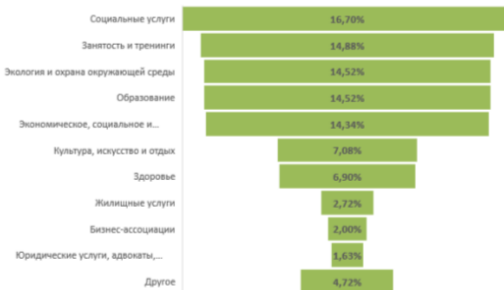
Рис. 2. Сфера деятельности субъектов социального предпринимательства в Европе, 2012 г. (все страны ЕС, N=581) [25, р. 39]

Основываясь на имеющихся данных, можно констатировать, что социальная экономика в странах ЕС (измеряется как совокупность объединений социального предпринимательства, ассоциаций и фондов) охватывает более 14,5 млн сотрудников, что эквивалентно примерно 6,5% работающего населения стран ЕС-27 и около 7,4% занятых в странах ЕС-15 (рис. 3). Эти данные включают также подавляющее большинство субъектов социального предпринимательства, поскольку они охватывают все социальные предприятия, использующие правовые формы организации экономики, такие, как социальные кооперативы и предпринимательские ассоциации.