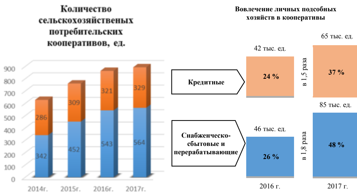
Рис. 1. Развитие сельскохозяйственных потребительских кооперативов (СПоК) в Липецкой области за 2014–2017 годы.

Еще одним положительным моментом в развитии экономики сельских территорий Липецкой области выступает сельскохозяйственная кооперация, на развитие которой в 2017 году из бюджета Липецкой области было направлено более 186 млн руб. В настоящее время в области создано 893 сельскохозяйственных потребительских кооператива, 14 народных предприятий и 3 акционерных общества, соответствующих критериям народных предприятий (рис. 2).