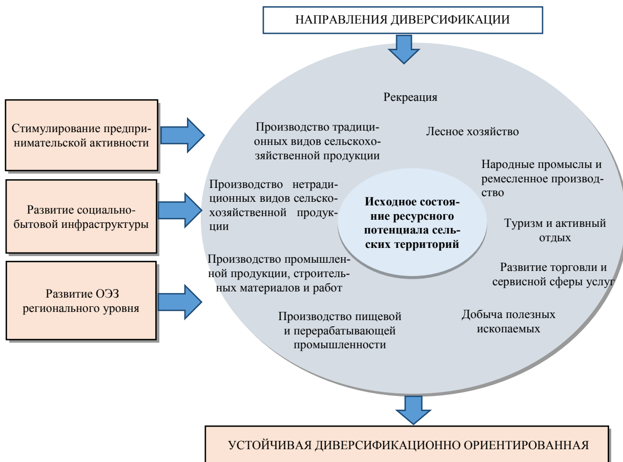
Рис. 3. Направления развития диверсификации экономики сельских территорий Липецкой области.

В целях повышения эффективности управления диверсификационным потенциалом сельских территорий, а также для разработки мер по наращиванию и устойчивому развитию села необходимо, на наш взгляд, основываться на комплексном и взаимосвязанном подходе, включающем три ключевые составляющие: ресурсы (формирование потенциала, способности (механизмы развития) и использование (рациональность расходования и накопление), которые, в свою очередь, будут способствовать более устойчивому и эффективному развитию сельской экономики и села в целом.