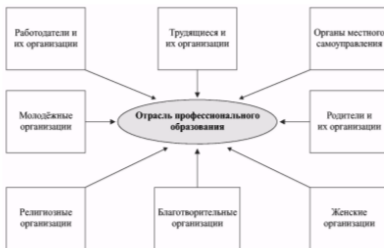
Рис 3. Внешние негосударственные партнеры

Особое внимание при организации социального партнерства должно быть уделено общественным партнерам (рис. 3).