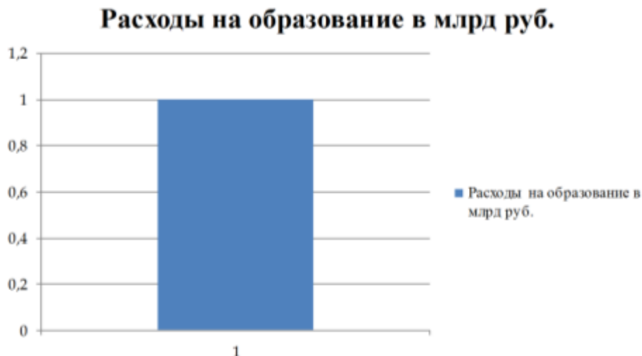
Рис.1. Расходы федерального бюджета по разделу «Образование»

Если расходы федерального бюджета на образование в 2017 г. были 3,7% от ВВП, то в 2018 г. они увеличатся лишь до 4%, что является недостаточной для реализации индивидуализации образования. Для полноценной реализации образовательных проектов, по мнению многих ученых, потребуется как минимум 4,8% от ВВП [2].