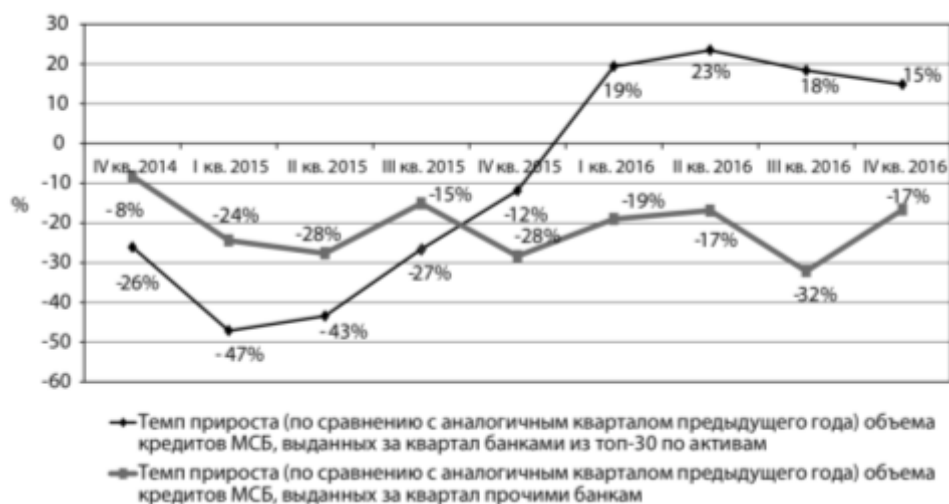
Рис. 1. Кредитный портфель МСБ по состоянию на 2015–2016 гг.

За 2016 г. ведущие банки увеличили объём выдачи на 18% против сокращения в 22% в 2015 г., которое произошло со стороны остальных более мелких кредиторов [10]. В совокупности доля выдачи кредитов банками из Топ-30 выросла до отметки 56,8%, что стало новым рекордом. До 2013 г. данный показатель не был отмечен выше чем 53,2%. Однако не по всем показателям 2016 г. наблюдалось стабильное улучшение ситуации. Совокупный портфель кредитов МСБ сократился на 8,5% до 4,5 трлн руб. по сравнению с 2015 г., что проиллюстрировано на рис. 1. Ключевым фактором, который оказывал влияние на динамику совокупного портфеля по МСБ, является краткосрочный характер кредитования, выдаваемые ссуды по которому в большей степени шли на пополнение оборотных средств.