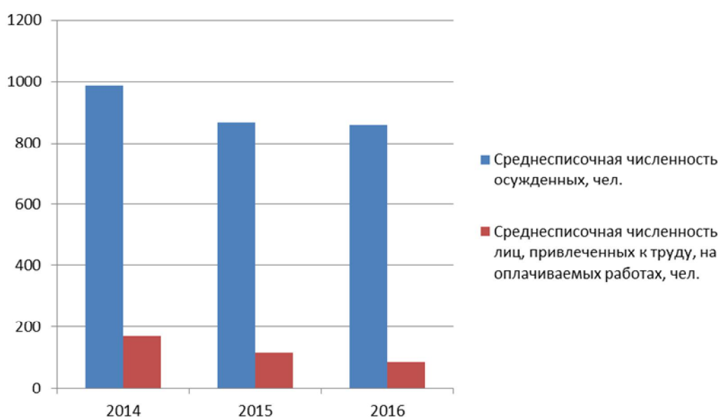
Рис. 3. Динамика численности осужденных ЦТАО ФКУ ИК-3 за 2014–2016 гг.

Среднегодовая выработка одного осужденного за исследуемый период возросла и составила к 2016 г. 495,82 тыс. руб./чел., что на 54,36% больше, чем в 2014 г., в котором рассматриваемый показатель составлял 321,86 тыс. руб.