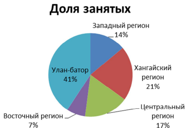
Рис. 4. Доля занятых к численности занятых в Монголии на 2016 год, %

В основе региональной политики Монголии лежит учет специфики регионов, перенос основных направлений экономических реформ на региональный уровень, всемерная поддержка местного самоуправления и предпринимательства, решение региональных социально-экономических проблем, рациональное использование природных ресурсов.