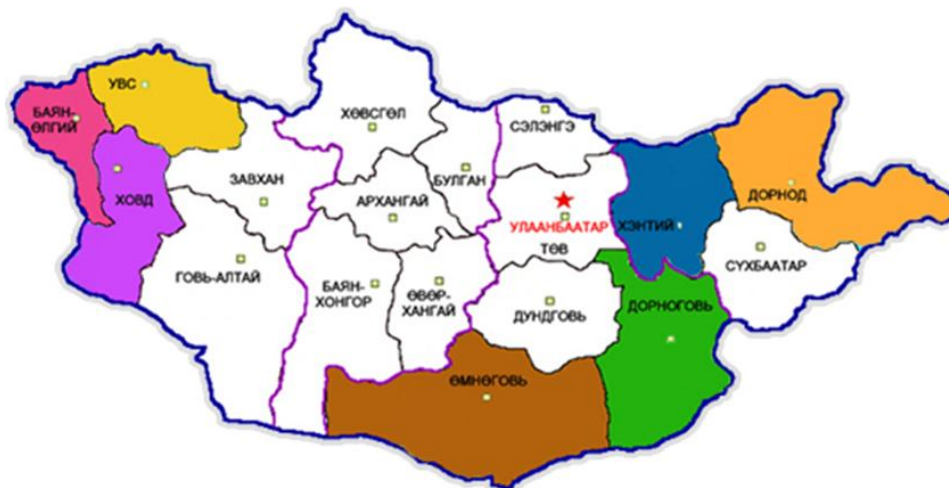
Рис.1. Региональное расположение Монголии