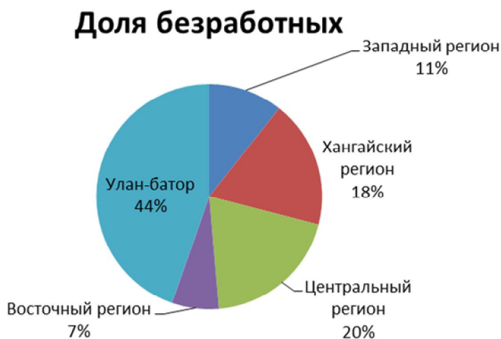
Рис. 5. Доля безработных к численности занятых Монголии на 2016 г., %

Обеспечение стабильного развития Монголии непосредственно связано с разработкой и реализацией правильной региональной экономической политики, как одного из важных звеньев системы стратегического управления национальной экономикой.