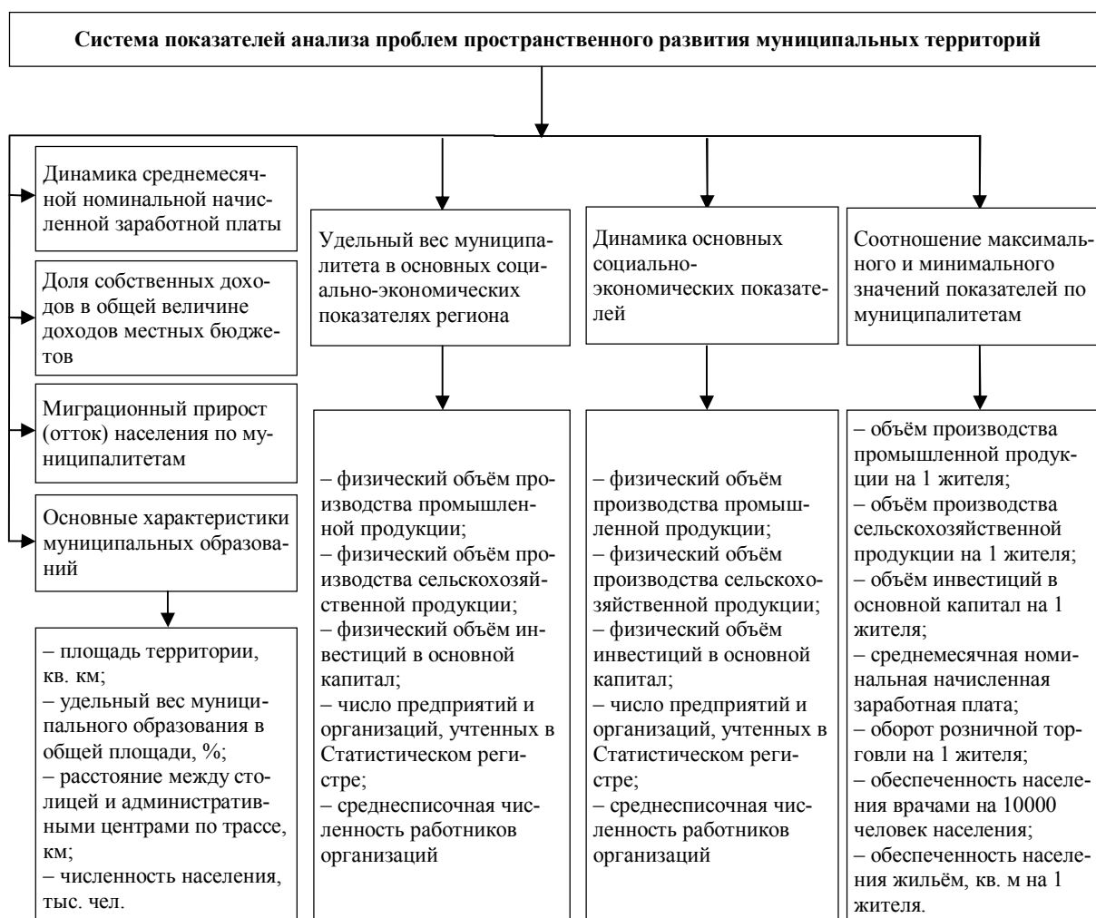
Рис. 1. Система показателей анализа проблем пространственного развития муниципальных территорий*

Важным элементом методики комплексной оценки является анализ проблем пространственного развития муниципальных образований. Наиболее распространенным способом оценки пространственных систем является автономный анализ относительных и абсолютных статистических показателей, которые дают количественную характеристику исследуемой территории за отчетный год или в динамике. Такой анализ может дополняться расчетом нескольких сводных индексов. Практика анализа пространственного развития территорий требует адаптации существующих подходов к муниципальному уровню. Для проведения анализа проблем пространственного развития муниципалитетов, на наш взгляд, целесообразно использовать систему показателей, представленную на рис. 1.