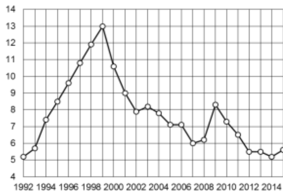
Рис. 2. Уровень безработицы (в процентах к численности экономически активного населения).

Начавшееся после 2000 года оживление экономики способствовало увеличению числа свободных рабочих мест, заявленных предприятиями и организациями в службы занятости, с 0,9 млн мест в 2000 году до 1,5 млн мест в 2014 году. Наконец, в 2015 году число вакансий в странах СНГ сократилось до 1,2 млн мест. В 1990–2000 годах в связи с сокращением государственного сектора экономики и расширением прав предприятий было заметно ослаблено государственное регулирование оплаты труда, что сказалось прежде всего на динамике реальной заработной платы и увеличении ее дифференциации.