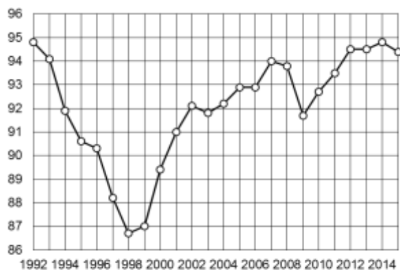
Рис. 1. Уровень занятости в экономике (в процентах к численности экономически активного населения).

Следует отметить, что период с 1992 по 1999 год отмечался стремительным ростом количества безработного населения, и лишь начиная с 1999 года ситуация стабилизировалась, что, несомненно, было связано с общей кризисной циклической ситуацией в стране, такая же ситуация была характерна и для 2009 года. К числу проблем в сфере занятости, возникших в эпоху реформирования, можно отнести структурную безработицу: хотя потребность в занятых росла, их квалификация зачастую не отвечала требованиям рынка. В экономике сохранялось нерациональное распределение рабочей силы по секторам экономики и по территории страны.