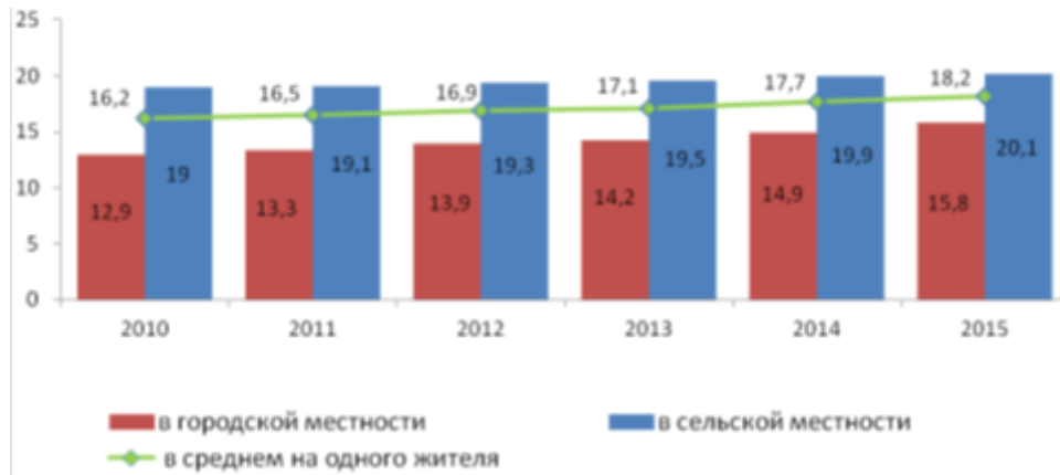
Рис. 1. Общая площадь жилых помещений, приходящаяся в среднем на одного жителя, Республика Дагестан, м 2