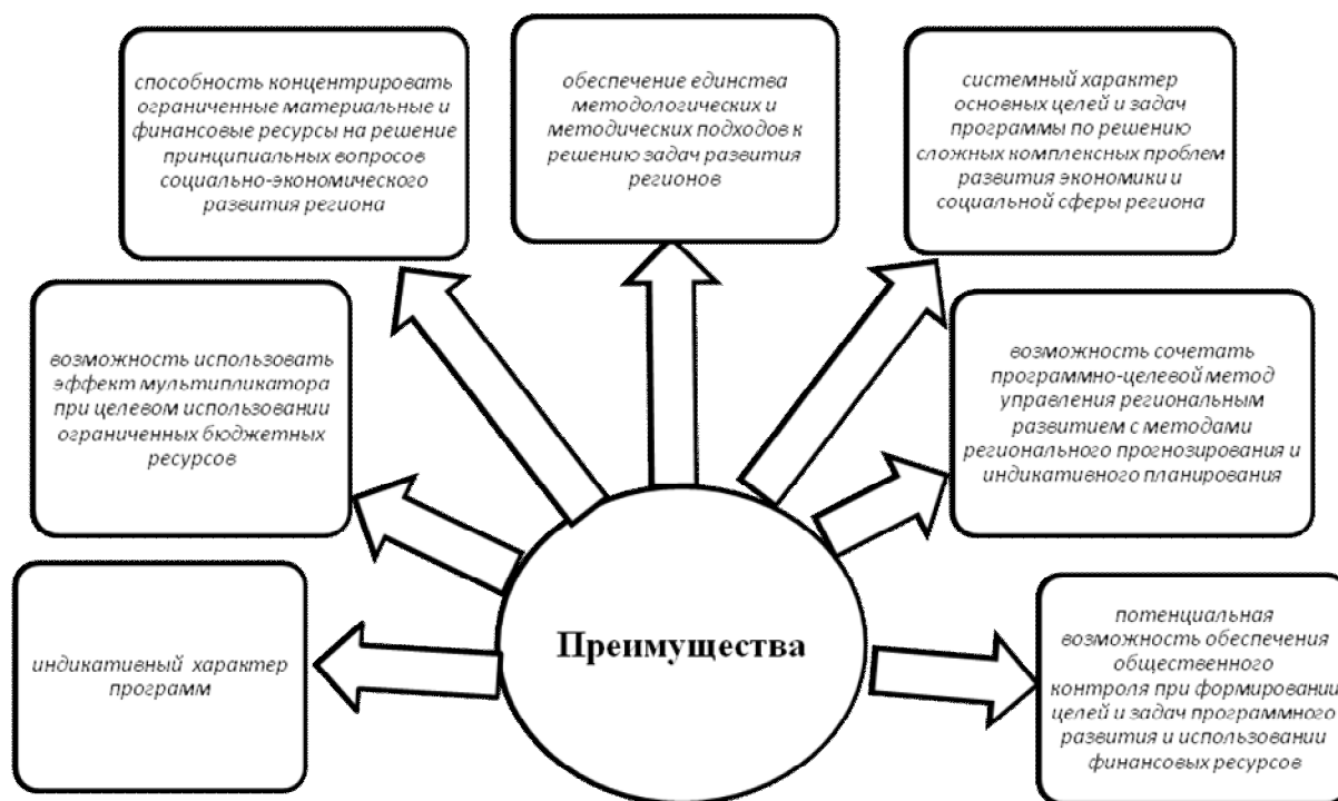
Рис. 4. Преимущества программно-целевого метода управления экономическим и социальным развитием регионов

Программно-целевой метод управления экономическим и социальным развитием регионов имеет свои преимущества, которые показаны на рисунке 4.