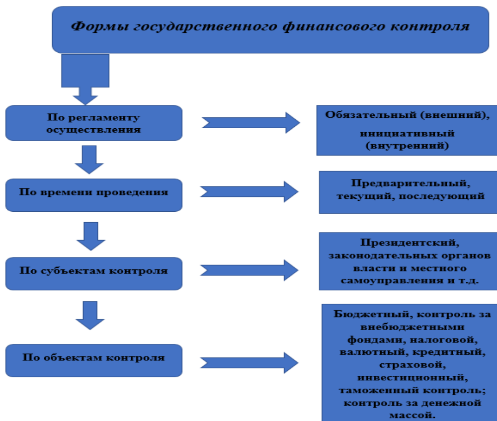
Рис.1. Классификация форм государственного финансового контроля

В свою очередь инициативный финансовый контроль осуществляется не на основании финансового законодательства, одновременно с этим непременно основываясь на нем. Инициативный финансовый контроль как правило осуществляется на основании и по инициативе соответствующего хозяйствующего субъекта для проверки внутренней рекомендации, а также профилактики нарушений финансового законодательства.