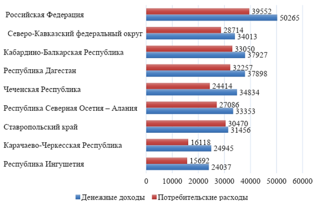
Рис. 2. Основные показатели, характеризующие уровень жизни населения в 2023 году (в среднем за месяц, в расчете на душу населения, рублей) [6]

По денежным доходам населения и потребительским расходам в Северо-Кавказском федеральном округе в 2023 году Республика Дагестан занимает второе место после Кабардино-Балкарии, на третьем месте Ставропольский край (рисунок 2).