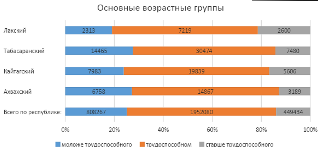
Рис. 2. Распределение численности населения по основным возрастным группам по районам Республики Дагестан на 1 января 2023 года (в процентах от общей численности)

По оперативным данным территориального органа статистики по Республике Дагестан в регионе родилось за 12 месяцев 2023 года 42075 детей. Это на 500 рождений меньше по сравнению с данными за предыдущий период (табл. 1). В целом по республике рождаемость снижается с 2015 года. За этот период число рождений сократилось на 12,3 тыс. рождений, что составляет лишь 77,6% от значения 2015 года. Также уменьшается число родившихся в муниципальных образованиях региона. Больше всего число родившихся уменьшилось в Табасаранском районе – на 552 рождений или почти на 45%. По Кайтагскому району снижение составило около 30%. По Ахвахскому району снижение незначительное – лишь 2%. Положительный прирост наблюдается в Лакском районе – на 3,4%, но это связано с тем, что этот показатель по району снижался до 2015 г., и к 2020 году он снова подрос.