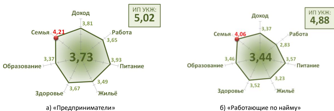
Рис. 3. Визуализация анализа усреднено показателя (в центре диаграмм) всех характеристик / факторов оценки успешности индивида (по всей выборке и гендерный анализ на рисунках а) и б) )