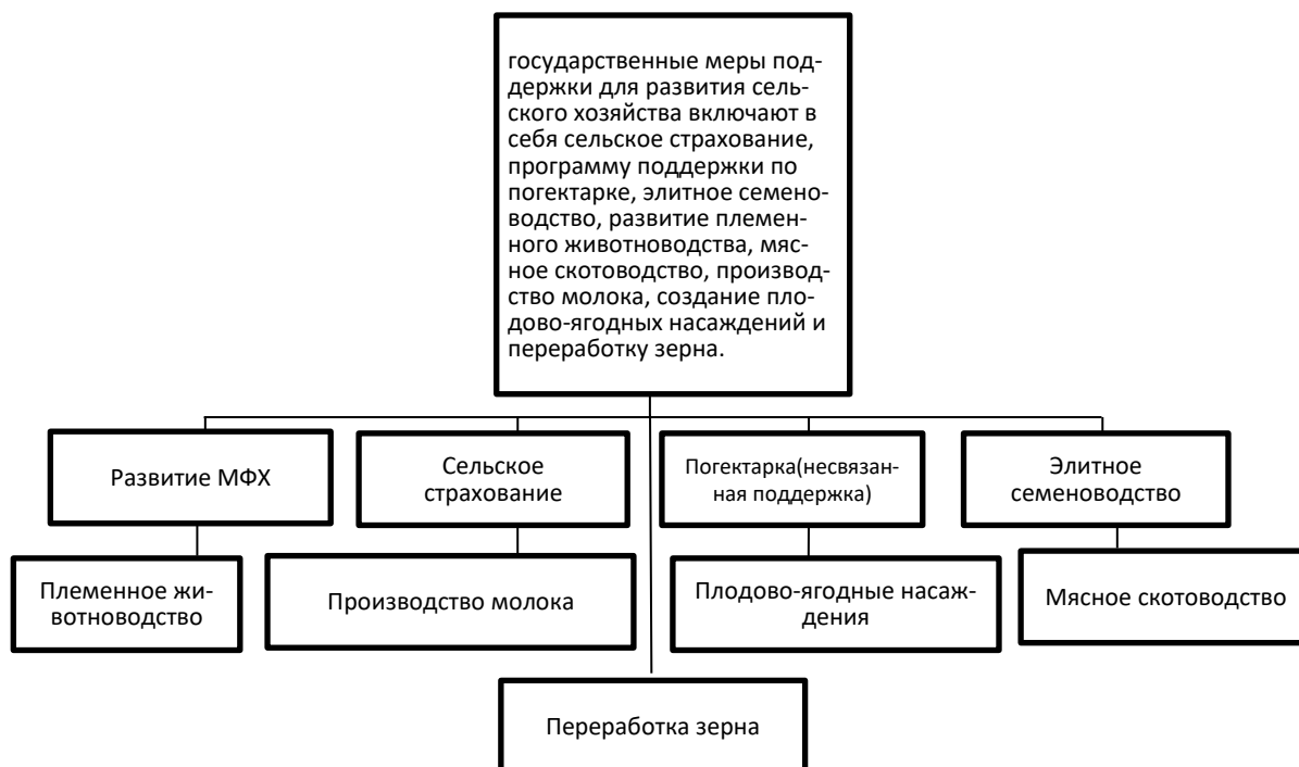
Рис. 2. Приоритетные направления государственной поддержки АПК с 2024 года в Российской Федерации *