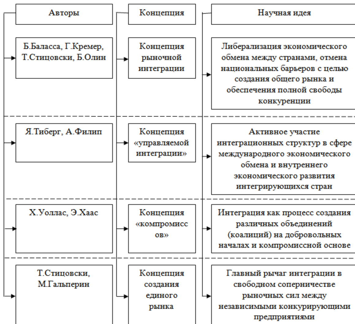
Рис. 1. Концепция развития теории интеграционных процессов в научной литературе (составлено автором)