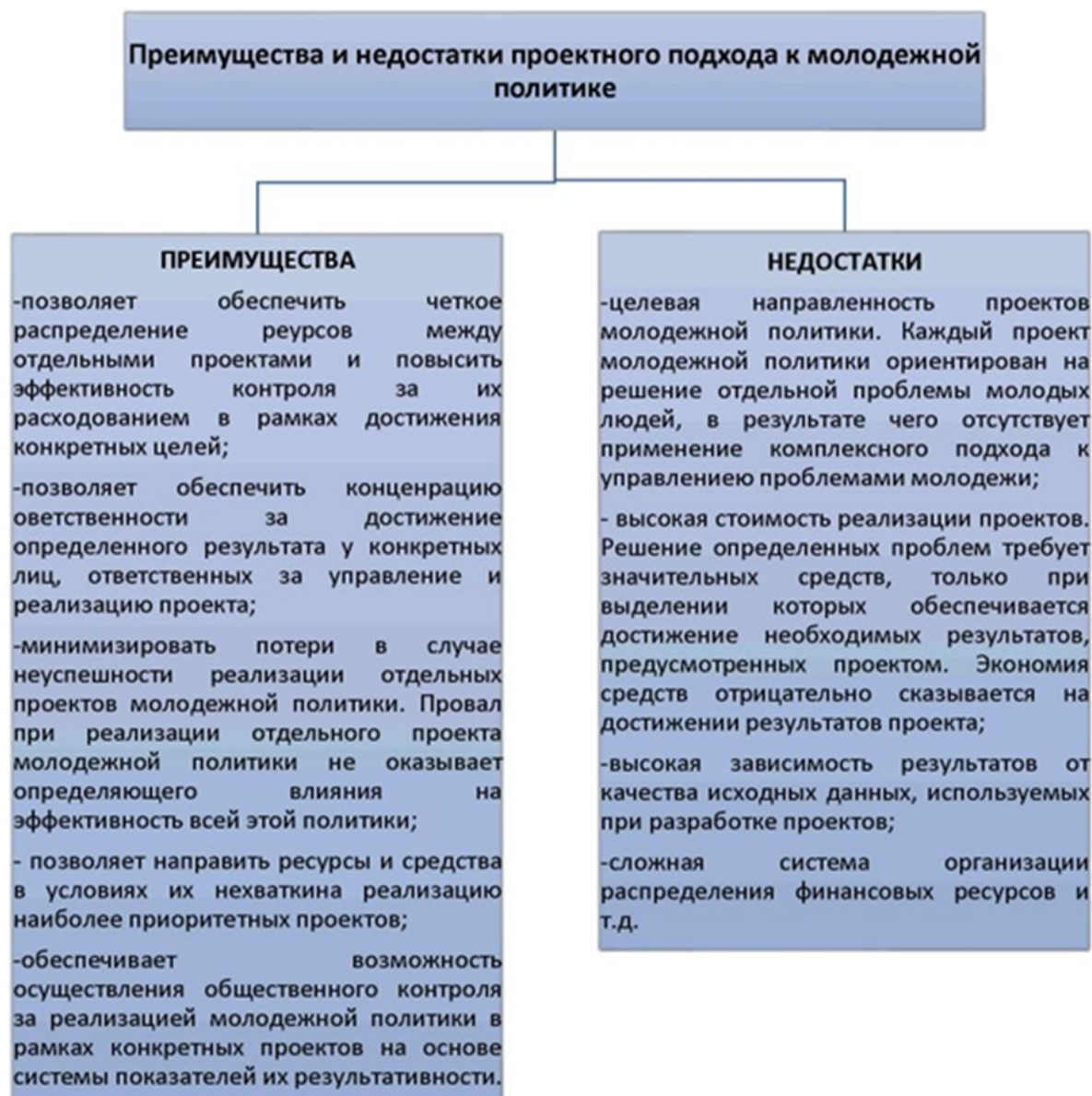
Рис. 1. Преимущества и недостатки применения проектного подхода в молодежной среде

Проектный подход к молодежной политике обладает многими преимуществами, но в то же время у него также присутствуют некоторые недостатки (рис. 1):