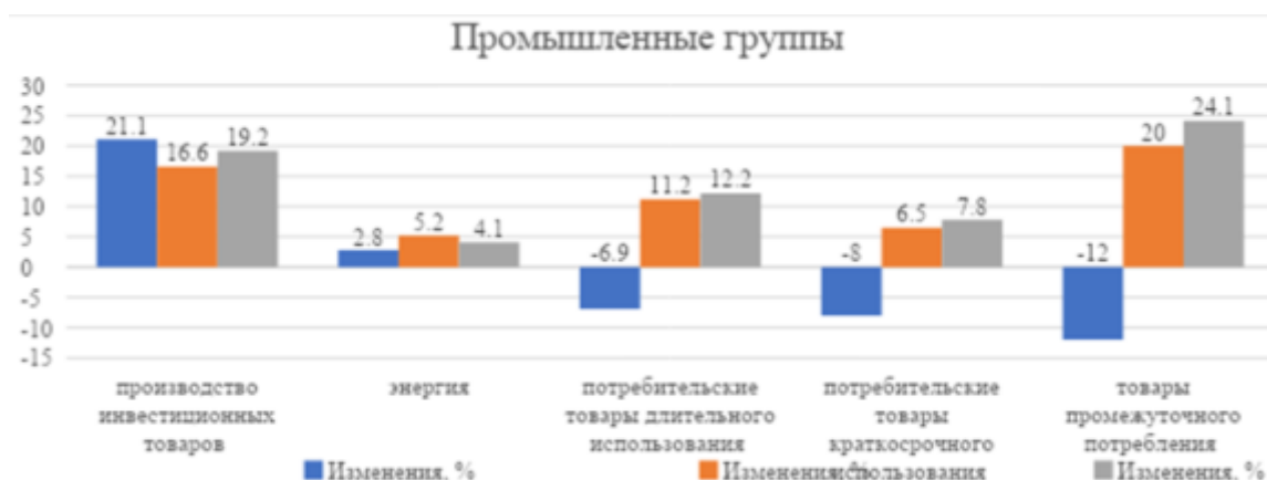
Рис. 1. Экономические показатели промышленных групп Донецкого региона за 2021- 2023 гг.

Для промышленных групп (потребительские товары длительного, краткосрочного и промежуточного потребления), имеющих отрицательные значения изменений в 2021 г., прогноз результатов 2023 г. сформирован экспертами с учетом неопределенности и степени риска. При-