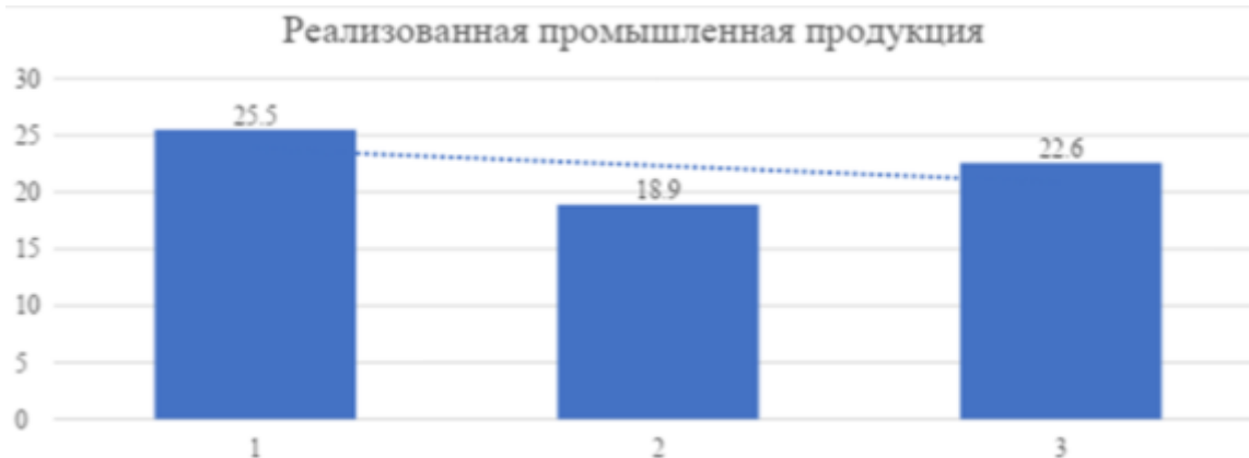
Рис. 2. Показатель «Реализованная промышленная продукция»: 2021-2023 гг., ДНР