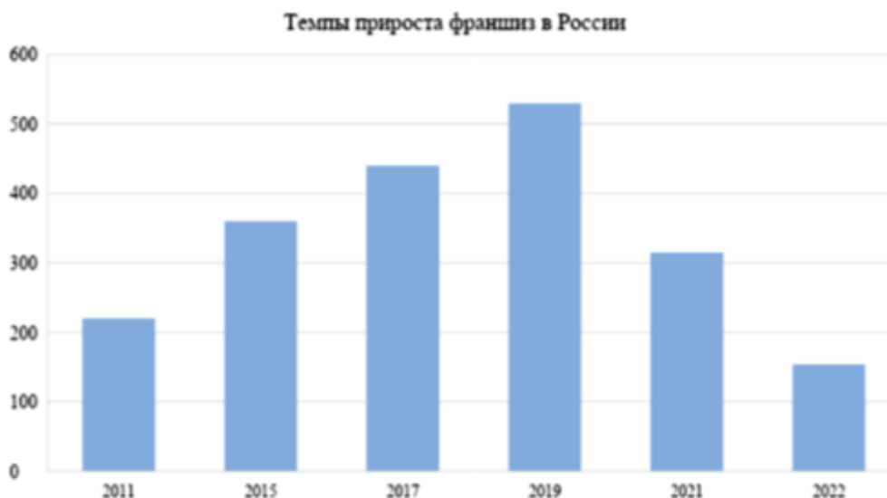
Рис. 1. Темпы прироста франшиз в России по годам

заявили свыше 300 международных франчайзинговых компаний, часть из них закрыли свои