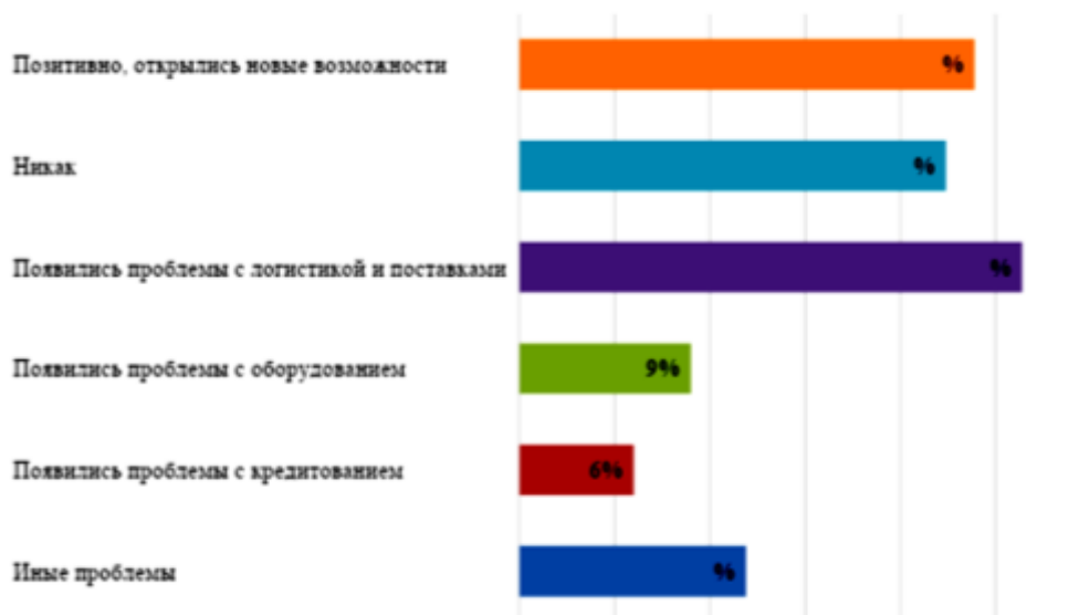
Рис. 5. Влияние санкции 2022 г. на франчайзеров в России

На фоне негативных прогнозов экспертов в первые месяцы 2022 года общая ситуация во франчайзинге оказалась вполне контролируемой. Так, согласно опросу, проведенному среди российских франчайзеров аналитической службой Franshiza.ru, 23,9% франчайзеров в России оценивают влияние санкций позитивно, на 22,4% опрошенных санкции никак не повлияли. Больше половины столкнулись с проблемами логистики, поставки, кредитования и иными проблемами [6]. При этом, по мнению респондентов, перечисленные проблемы являлись ре-