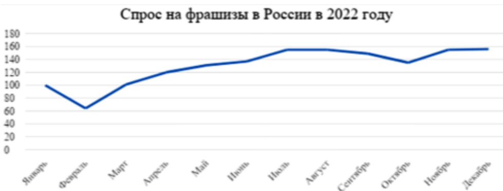
Рис. 2. График спроса на франшизы в России за 2022 год

Согласно аналитической информации портала франшиз Businessmens.ru, после событий 24 февраля 2022 года общее количество заявок на приобретение франшизы в разных сферах в России упало на 40% [1]. По мнению экспертов, «снижение спроса особенно чувствовалось в марте – тогда на рынке царил всеобщая растерянность. К середине мая активность в сфере