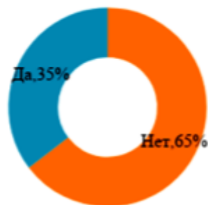
Рис. 4. Доля франчайзеров имеющих франчайзи за пределами РФ