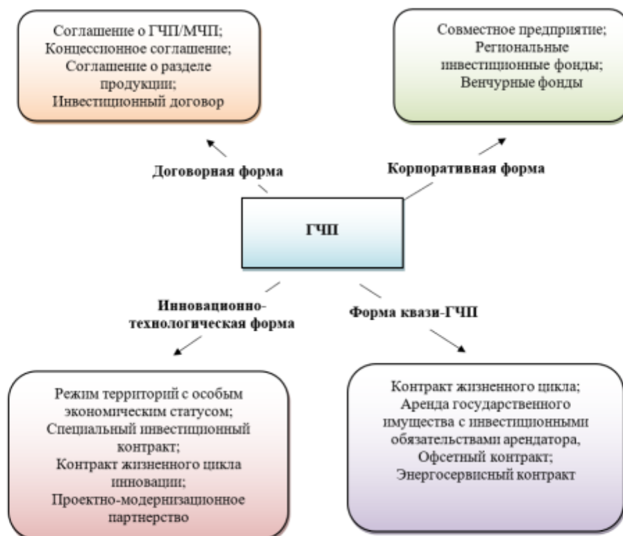
Рис. 3. Классификация форм ГЧП (дополнено автором).

Корпоративная модель взаимодействия власти и бизнеса в современных условиях принимает различные формы: от совместных бизнес-структур до сложных территориальных структур различного уровня и масштаба. Существенной особенностью корпоративной модели является то, что формируется общий капитал участников корпоративного образования, который ориентирован на осуществление социально-полезной деятельности [8].