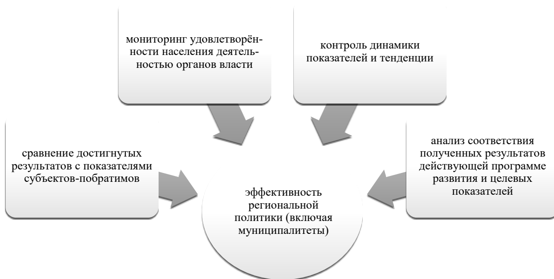
Рис. 2. Система оценки эффективности управления.

Вместе с тем, эффективная политика заключается в способности быстрой реакции на меняющиеся политические и социально-экономические условия.