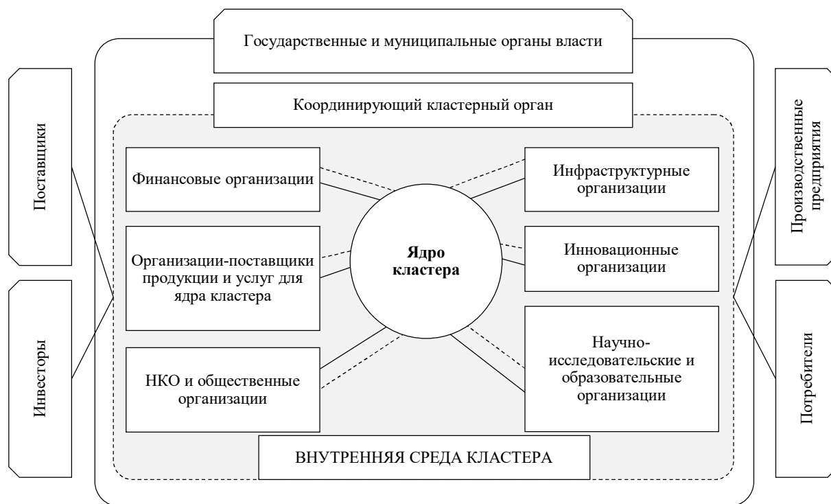
Рис. 2. Унифицированная модель кластера (составлено автором на основании [17, с. 39]).

образовательное ядро и взаимосвязи с партнерами, которыми могут выступать учреждения и управленческие структуры региона / субъекта, в границах которого находится кластер, направленный на повышение конкурентных преимуществ организаций-членов кластера, региона и экономики в целом. Модель кластера как система предприятий и взаимоотношений между партнерами и научно-образовательным ядром, которую можно определить исходя из сформированного выше понятия, представлена на рисунке 2.