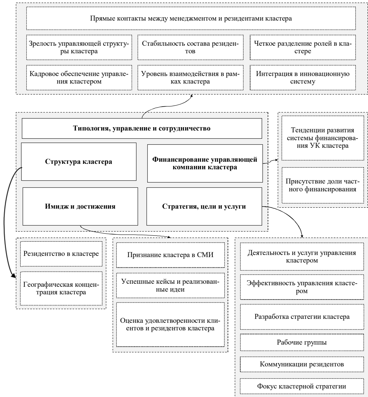
Рис. 3. Критерии оценки качества управления кластером по методологии ESCA (составлено автором на основании [10, с. 13; 19]).

Согласно результатам сравнительного анализа, который был проведен в 2012 году А. Песоа, азиатскую кластерную политику принято считать наиболее эффективной в области формирования и поддержки кластеров, чего нельзя сказать о кластерной политике государств-членов Организации экономического сотрудничества и развития (ОЭСР / OECD) [2, с. 51-52; 24, с. 77]. Данное заключение связано прежде всего с тем, что в странах OECD отдается предпочтение минимальному воздействию государства на кластерную политику в регионе.