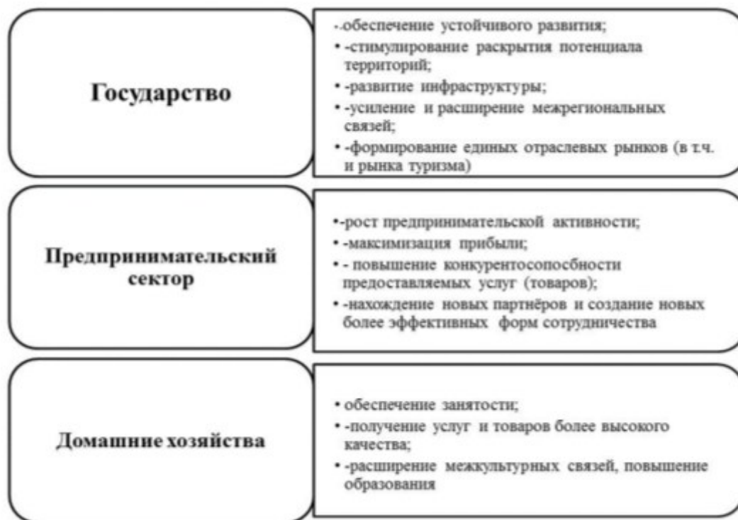
Рис. 1. Направления воздействия туристских проектов [12].

Анализируя научные исследования ученых в области туристско-рекреационного, мы при-