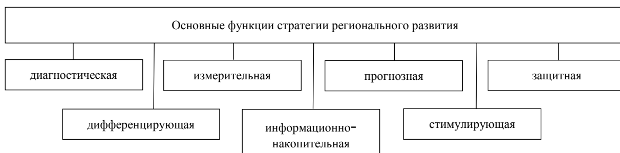
Рис. 3. Основные функции стратегии регионального развития

Повышение конкуренции, движение с большой скоростью перемен, которые мы можем наблюдать в настоящее время в обществе и экономике, подталкивают государство к разработке механизма управления устойчивым развитием региона. Подобные глобальные вызовы не