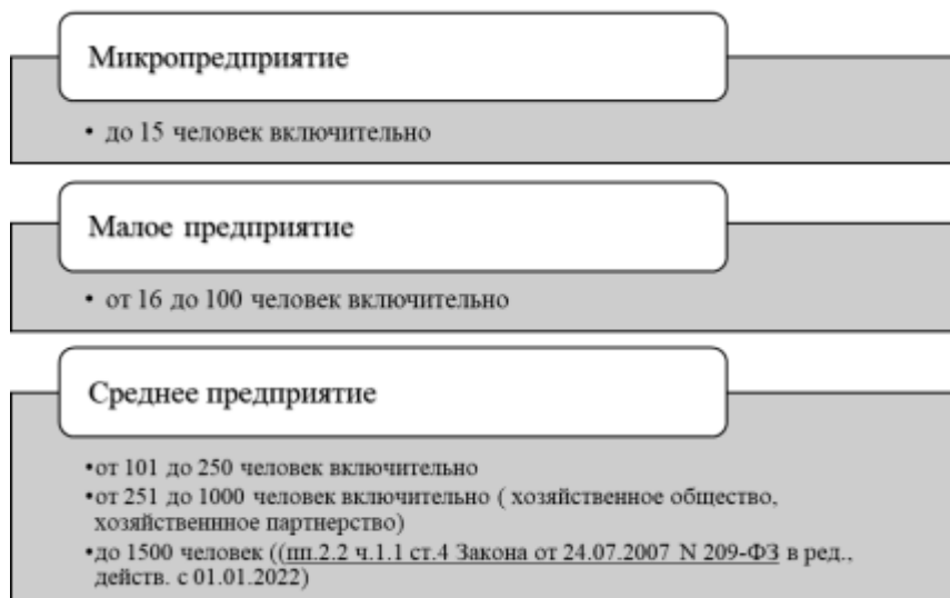
Рис. 1. Критерии по численности.

доказательство того, что данная тема еще долго будет интересовать экономистов, а изменяющиеся условия в мире, современные вызовы, которые, естественно, оказывают влияние на субъекты МСП, требуют дальнейшего изучения особенностей и перспектив развития субъектов МСП и их адаптацию к современным реалиям.