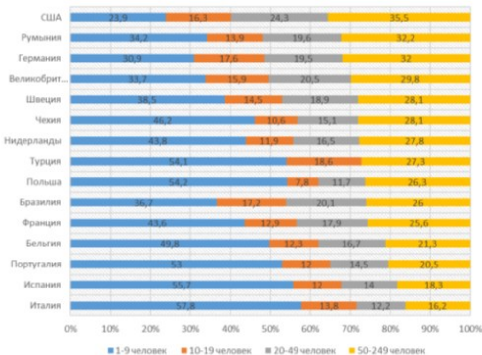
Рис. 5. Структура занятости сектора МСП в развитых странах.