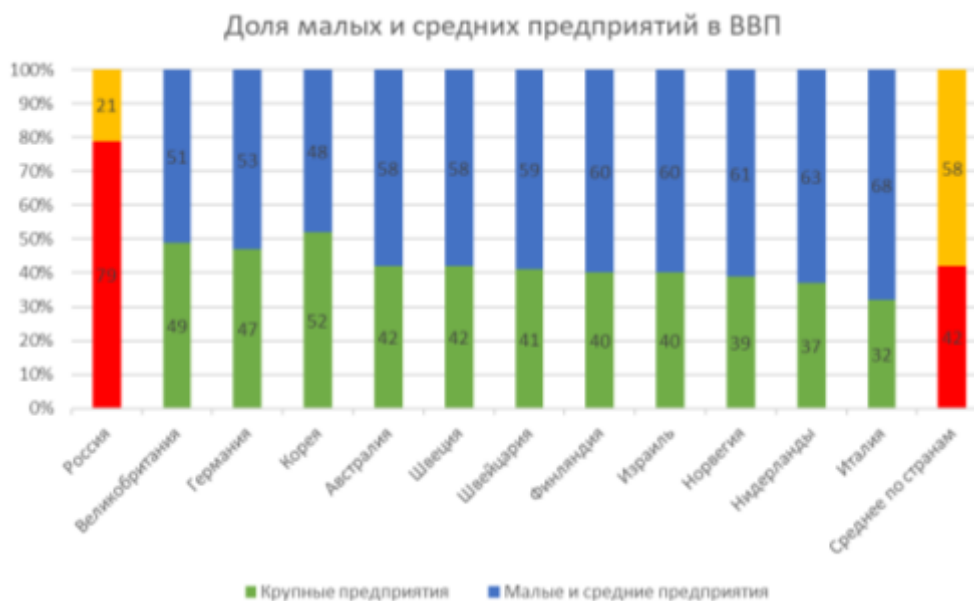
Рис. 2. Доля малых и средних предприятий в ВВП.

Кроме того, по удельному показателю доли МСП в ВВП, если по развитым странам Европы доля МСП практически наравне с крупными предприятиями, чего не скажешь о РФ. Практически во всех развитых зарубежных странах на долю малых предприятий приходится более 40 % ВВП, в России этот показатель составляет 21 %, что говорит о низком уровне развития