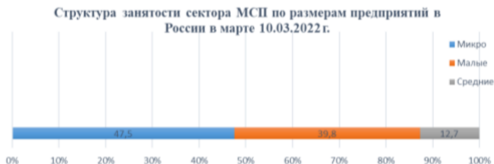
Рис. 4. Структура занятости сектора МСП по размерам предприятий в России в марте 10.03.2022

Источник: Единый реестр субъектов малого и среднего предпринимательства, 2022