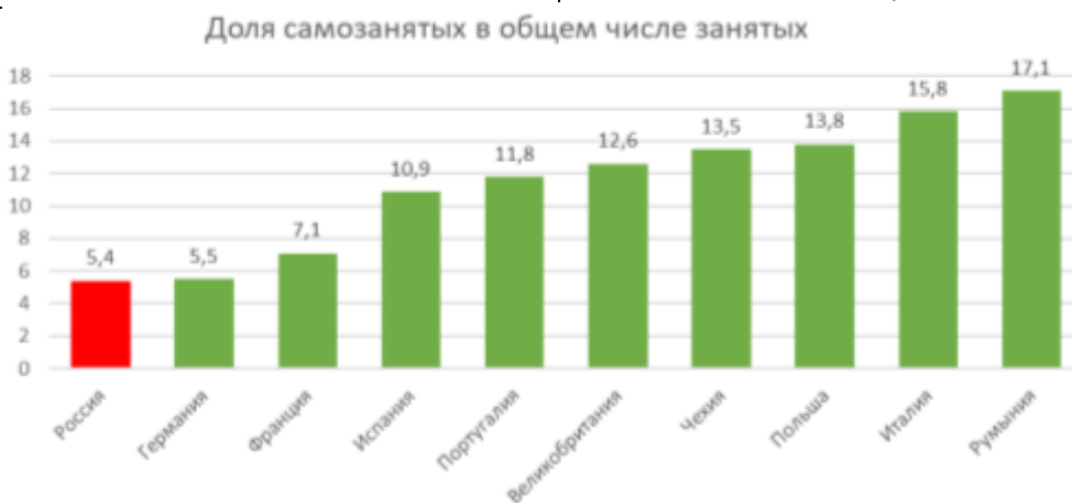
Рис. 6. Доля самозанятых в общем числе занятых.