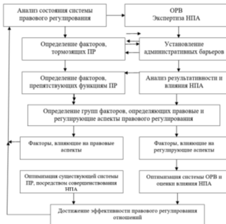
Рис. 3. Алгоритм преодоления низкой эффективности правового регулирования

Объединение строк и столбцов даст общую картину эффективности правового регулирования, которая может быть рассчитана либо по формуле: E_1 = 1 - N_1/O_1 , где E_1 – эффективность;