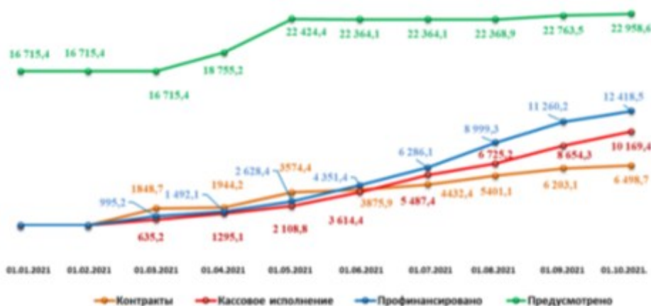
Рис. 1. Финансирование национальных проектов на 01.10.2021 г. (млн руб.)