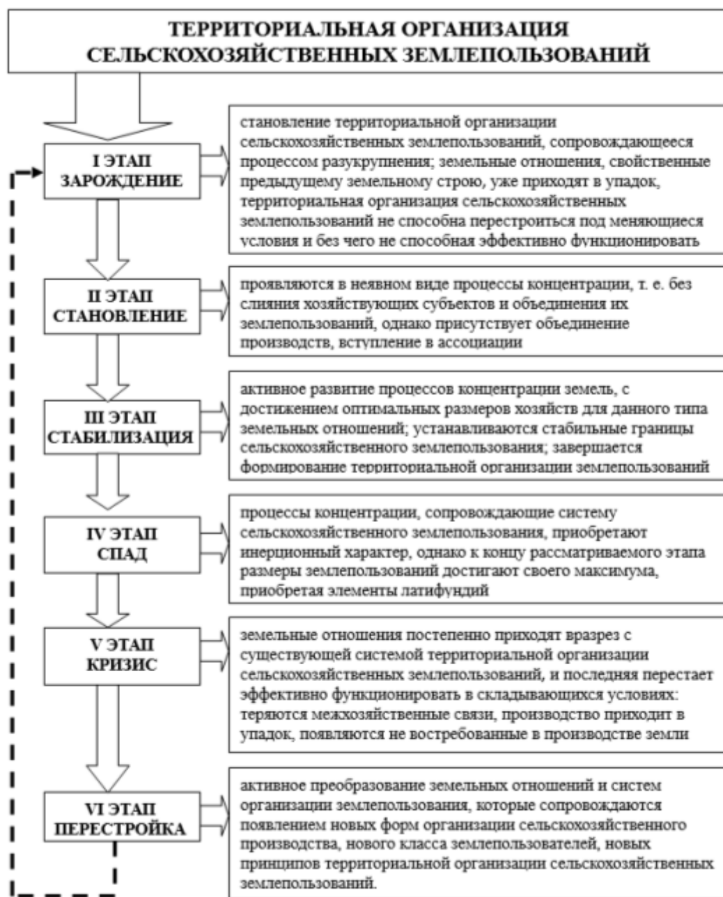
Рис. 2. Цикличность развития территориальной организации сельскохозяйственных землепользований с учетом процессов разукрупнения и концентрации.

Мировой и отечественный опыт показывает, что реальным средством наведения порядка в использовании земель, переустройстве территории и регулировании земельных отношений может быть только землеустройство, обеспечивающее переход к новому земельному строю с соответствующими формами хозяйствования, землевладения и землепользования [6].