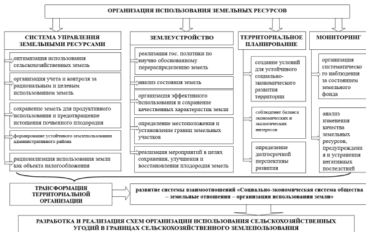
Рис. 1. Организация использования земельных ресурсов.

Организация использования земли включает в себя широкий спектр вопросов, связанных с