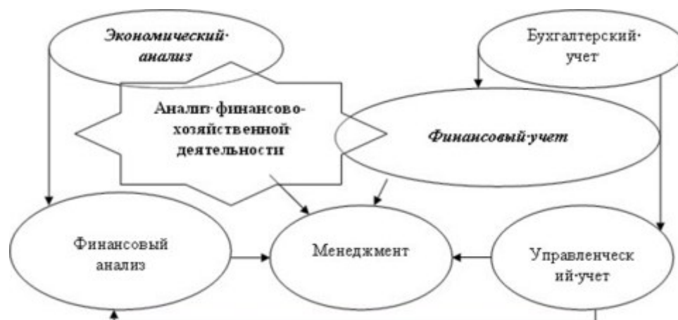
Рис. 1. Положение анализа ФХД в системе экономических дисциплин

Аналитическое исследование хозяйственности затрагивает несколько аспектов производственной активности учреждения. В их числе: