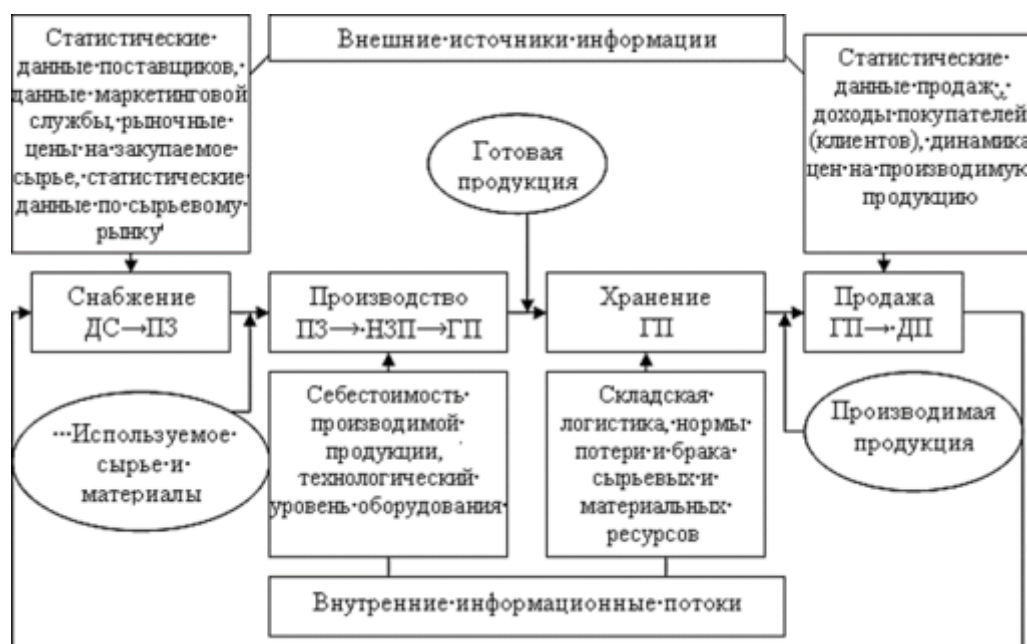
Рис. 3. Базовые инфопотоки анализа ФХД учреждения в рамках производства

При проведении исследовательской работы установлено, что рынок ПО, разработанного для аналитического исследования ФХД, содержит несколько решений, но спрос на них низкий. Фактически при работе над задачами аналитического изучения ФХД наиболее частый инструмент – программа MS Office Excel. Ее применение не связано со специализированными тратами на покупку и обучение работников. Возможности, предоставляемые табличной программой, достаточны для проведения аналитического исследования ФХД, но они значительно уже, нежели те, что открывают специализированные программные решения.