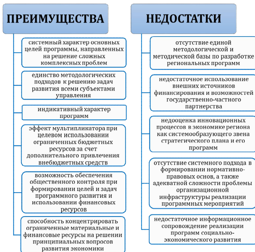
Рис. 2. Преимущества и недостатки программно-целевого метода

Программно-целевой метод имеет принципиальные особенности, которые определяют его преимущества, а также недостатки (рис. 2)