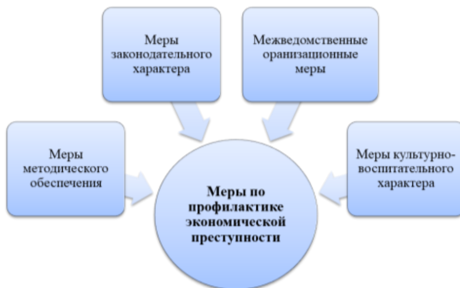
Рис. 3. Меры по профилактике экономической преступности.

2. Своевременное препятствование отмыванию доходов, которые были получены преступным путем, определение каналов, по которым финансируются террористические и экстремистские формирования.