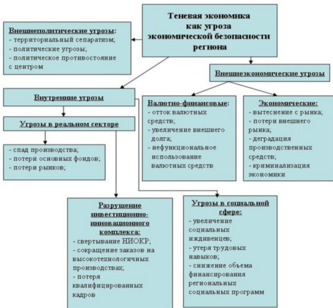
Рис. 2. Место теневой экономики в структуре угроз экономической безопасности региона.

нелегальные институты. Кроме того, хозяйственные взаимодействия, которые не подчиняются существующим правилам и правовым нормам и создают теневой сектор экономики, а их раз-