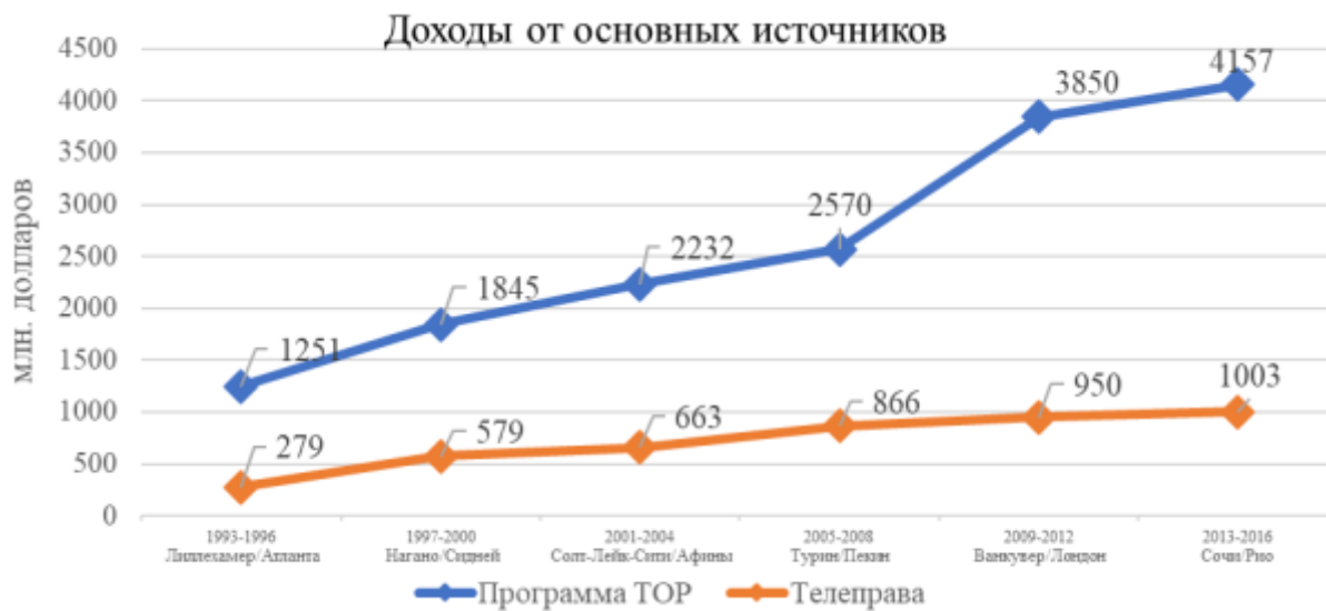
Рис. 4. Доходы МОК в период с 1993 по 2016 год.

Данные, представленные на рисунке 4, показывают растущую динамику как от программы TOP, так и телевидения. Также видно, что доходы от телевидения значительно уступают доходам от спонсоров.