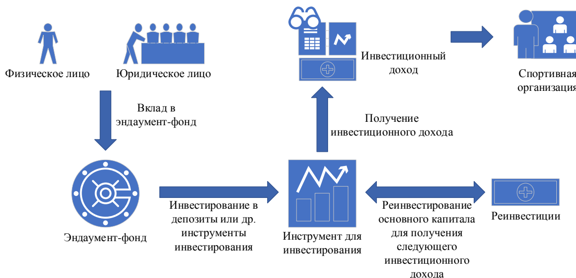
Рис. 1. Схема финансирования спорта через эндаумент-фонд.

После получения финансовой поддержки от эндаумент-фонда спортивная организация может направить ее на развитие культивируемого вида спорта, поддержку тренеров или спортсменов и т. д. Данная система финансирования получила широкое распространение в США. Исследования в области поиска механизмов эндаумент-фондов как инструмента смешанного финансирования социальной сферы проводили ученые Чуева Т. И., Ниязова Г. М. и др. [19].