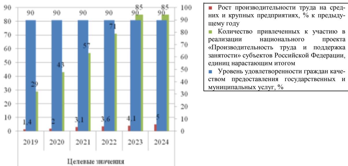
Рис. 3. Целевые показатели совершенствования управления государственным имуществом

Согласно данным табл. 2 и рис. 3, уровень удовлетворенности граждан работой Агентства с 2019 по 2024 гг. по результатам реализации программ должен составлять не менее 90%, при этом рост производительности труда должен за годы составить не менее 5,0%, а субъекты, участвующие в национальном проекте «Производительность труда», должны включать в себя все регионы, при этом общее число предприятий должно составить не менее 10000 единиц.