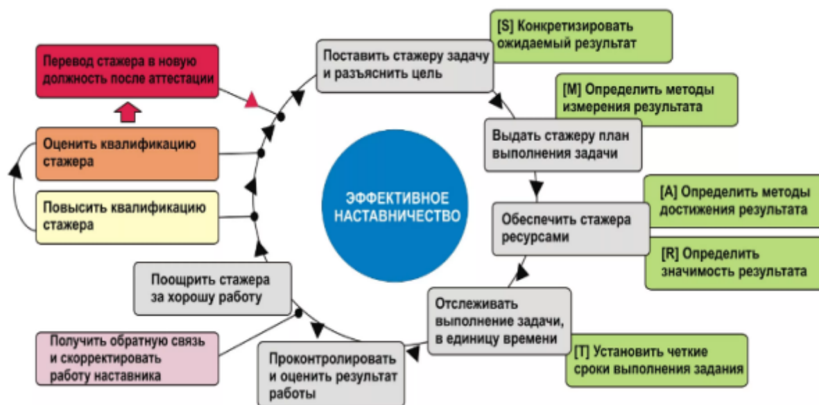
Рис. 6. Принцип работы смарт-концепции в отделе реализации арестованного, конфискованного и иного имущества

Особое значение в отделе приобретает реализация смарт-концепции проектного управления при найме и подборе кадров (см. рис. 6).