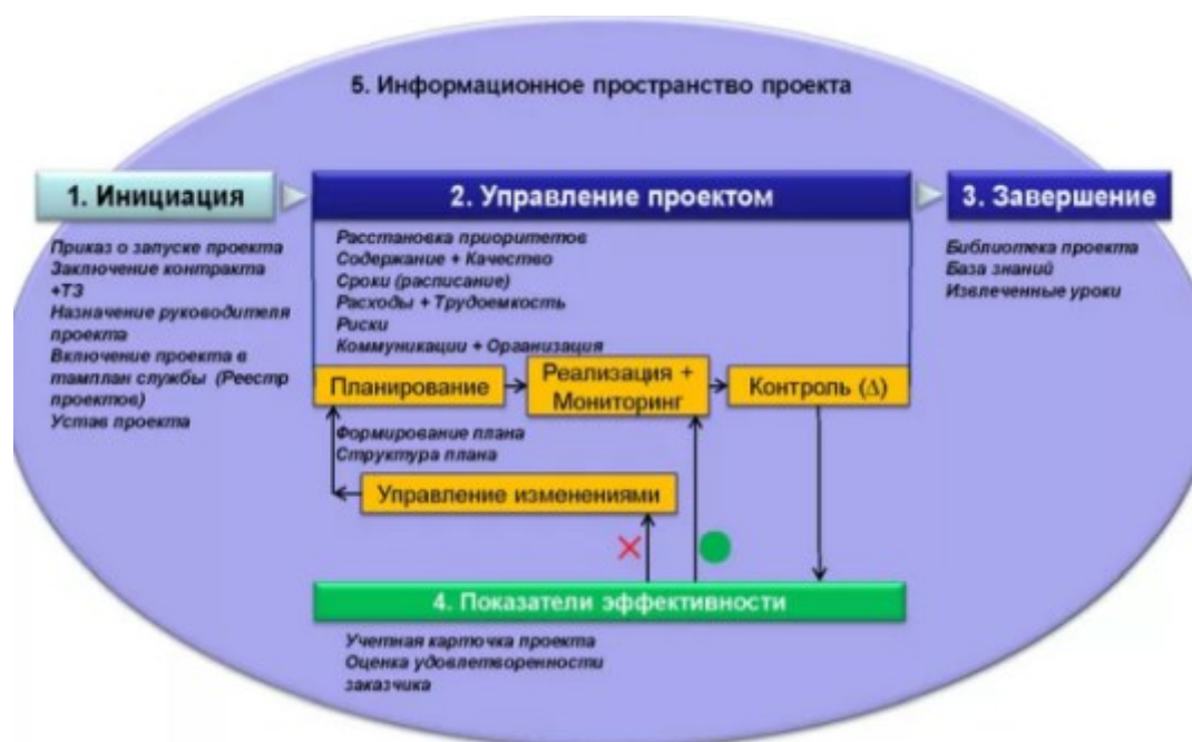
Рис. 5. Этапы осуществления проектного управления в отделе реализации арестованного, конфискованного и иного имущества, обращенного в собственность государства