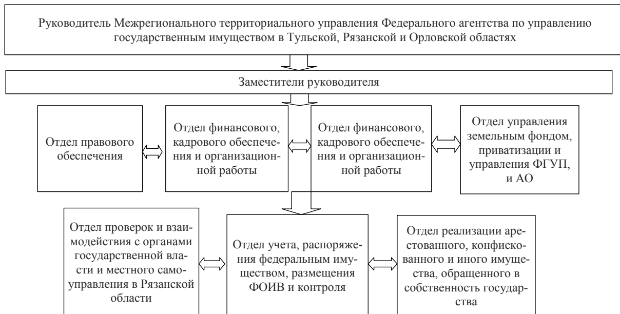
Рис 1. Структура межрегионального территориального управления по Орловской, Рязанской и Тульской области

Проектное управление при распоряжении имуществом (в т. ч. имущественных прав), арестованным во исполнение судебных решений или актов органов, осуществляется отделом реализации арестованного, конфискованного и иного имущества, обращенного в собственность государства [15]. В частности, отдел осуществляет следующие виды проектного управления: