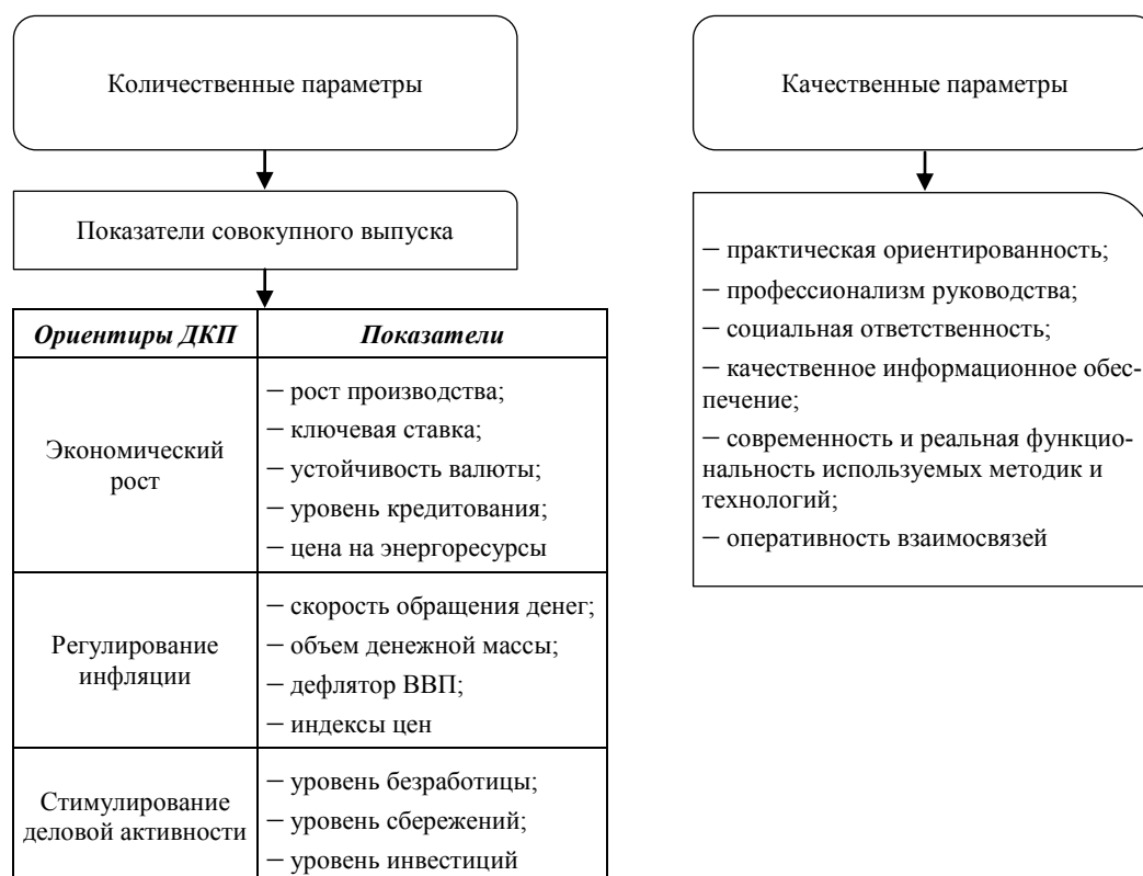
Рис. 2. Количественные и качественные критерии эффективности ДКП.

Очевидно, что в настоящее время внешние условия достаточно серьезно отражаются на внутреннем спросе, а именно на потребительском, инвестиционном и государственном. Высокая зависимость доходов страны от цен на углеводороды может влиять как на динамику колебания курса валюты, так и на денежную массу в стране. Снижение зависимости от разного вида колебаний возможно путем создания привлекательной инфраструктурной среды для внутреннего и внешнего сектора.