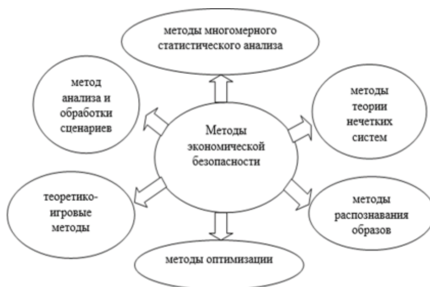
Рис.1. Методы экономической безопасности [18]

Методы исследования. Общие методы экономической безопасности представлены на