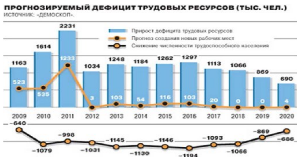
Рис. 2. Прогнозируемый дефицит трудовых ресурсов к 2020 г.

А снижение профессиональной подготовки ведет неизбежно к дефициту трудовых ресурсов, что наглядно демонстрирует диаграмма (рис. 2), что собственно и имеет место. Результаты дефицита трудовых ресурсов в 2020 г. ожидаются еще более печальными. Более того, эта