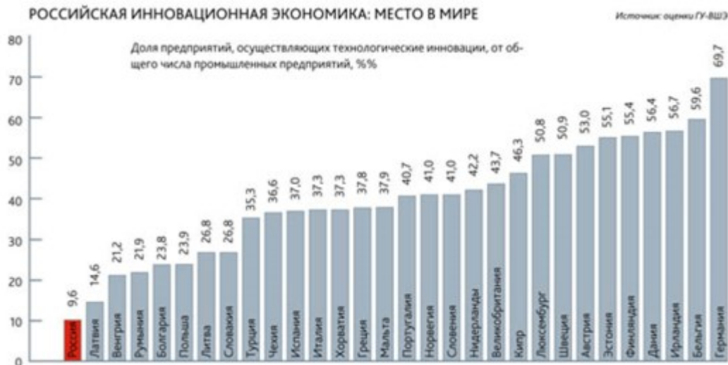
Рис. 5. Место в мире России по инновационной экономике

В 2018 г. разработку, внедрение, коммерциализацию НИОКР и инноваций осуществляли 9,6% общего числа российских предприятий, в то время как в таких странах, как Германия, Австрия порядка 60% (рис. ?).