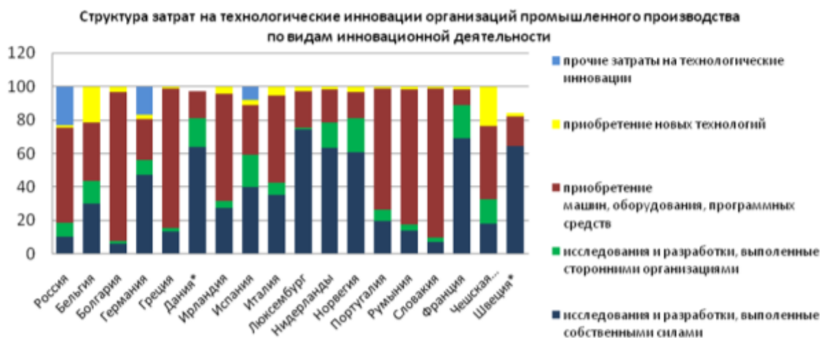
Рис. 4. Структура затрат на технологические инновации по видам инновационной деятельности

По данным Евростата, в структуре затрат на технологические инновации по видам инновационной деятельности в 2019 г. можно увидеть отставание России от других стран в несколь-