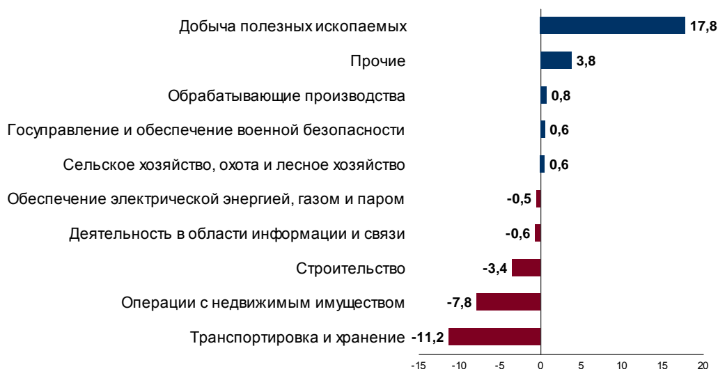
Рис. 4. Вектор структурных сдвигов инвестиций в основной капитал Арктической зоны РФ за 2008–2019 гг., п.п.

В структуре инвестиций по видам экономической деятельности наиболее существенный рост в 2008–2019 гг. пришелся на добычу полезных ископаемых (рис. 4) и, в основном, был обусловлен ростом инвестиций в добывающую промышленность Ямала, Красноярского края и Республики Саха (Якутия). Незначительное увеличение доли инвестиций в обрабатывающую промышленность (с 7,2 до 8,0%) было обеспечено ростом вложений в металлургическое производство Мурманской и Архангельской областей.