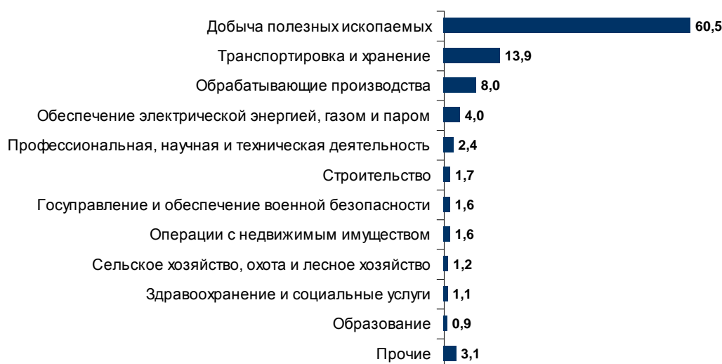
Рис. 1. Удельный вес видов экономической деятельности в структуре инвестиций в основной капитал Арктической зоны РФ, 2019 г.