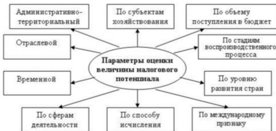
Рис. 2. Основные параметры оценки величины налогового потенциала

В связи с этим важнейшим фактором, влияющим на возможности инвестиционного развития территорий, является фактическая величина собранных налогов и сборов и их налоговые базы. Эта величина и используется в качестве меры налогового потенциала. Существуют различные параметры оценки величины налогового потенциала (см. рисунок 2).