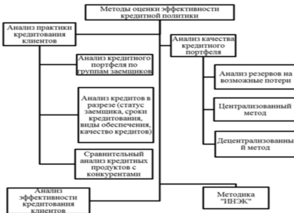
Рис. 2. Методы оценки эффективности кредитной политики банка [18].

Оценка эффективности кредитной политики определяется наглядно на рисунке 2 [18].