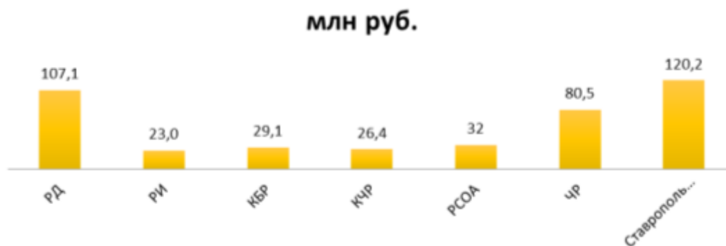
Рис. 1. Расходы консолидированных бюджетов в 2018 г. республик СКФО

В 2018 г. распределение расходов консолидированного бюджета по регионам СКФО выглядело следующим образом (рис. 1).