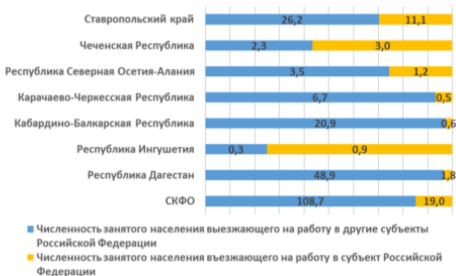
Рис. 4. Межрегиональная трудовая миграция в 2018 г. (тыс. человек)

Источник: официальный сайт Росстата. – URL : http://www.gks.ru [15,16]