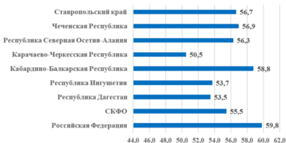
Рис. 1. Уровень занятости населения в 2018 г. (%)

По уровню занятости населения Северо-Кавказский федеральный округ в целом и все его регионы на конец 2018 г. отстают от среднероссийского значения (рис. 1). Самые низкие показатели по уровню занятости в округе у Карачаево-Черкесской Республики и Республики Дагестан.