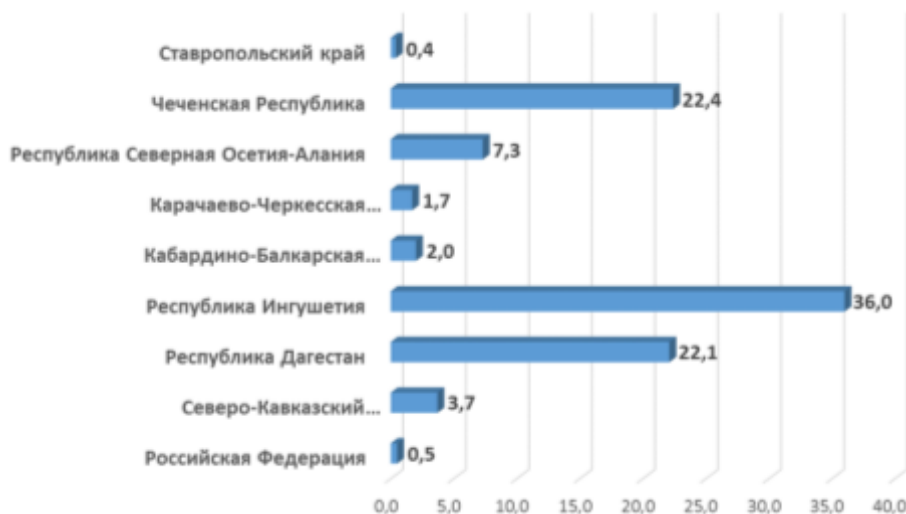
Рис. 3. Нагрузка незанятого населения, зарегистрированного в органах службы занятости населения, на одну заявленную вакансию в 2018 г. (чел.)