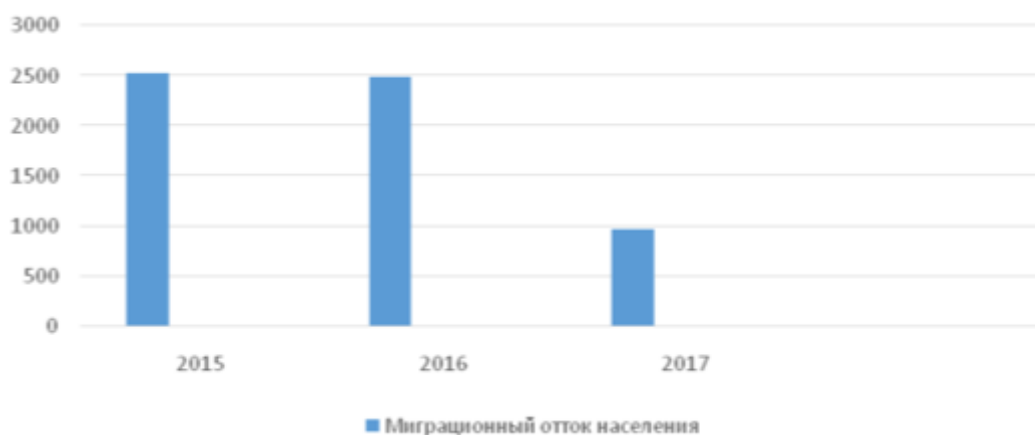
Рис. 3. Миграционный отток населения Карачаево-Черкесской Республики в 2015–2017 годах, человек (визуализировано автором по данным [7])

Миграция трудоспособного населения непосредственно влияет на рынок рабочей силы, сокращая или увеличивая ее предложение, а также способствует усилению конкуренции на рынке труда. Миграционные процессы в Карачаево-Черкесской Республике характеризуются оттоком населения. Однако наметилась устойчивая тенденция сокращения миграционного оттока, и за 2015–2017 годы отток уменьшился на 1558 человек, или на 61,7 % (рисунок 3).