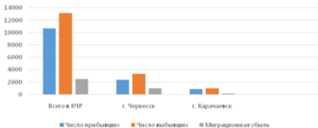
Рис. 4. Динамика миграции населения в городах Карачаево-Черкесии в 2016 году, человек (визуализировано автором по данным [7])

Республиканские работодатели не проявляют интереса к труду иностранных высококвалифицированных специалистов, т. к. они предъявляют требования к достойной оплате труда наравне с местными высококвалифицированными специалистами.