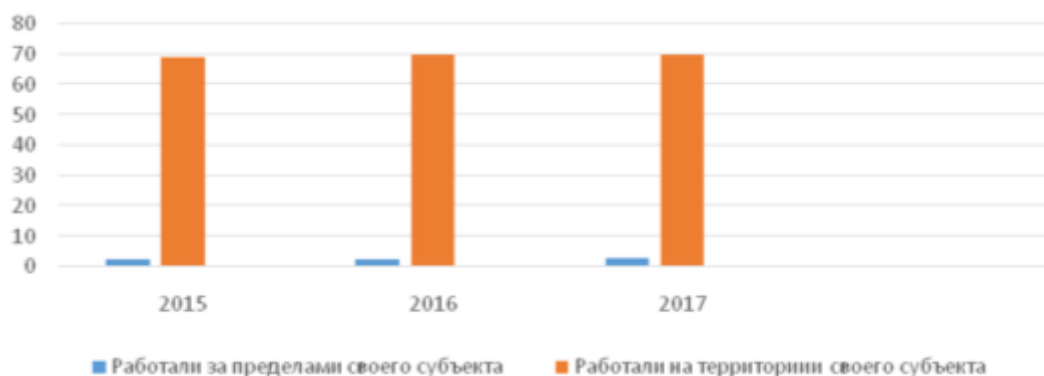
Рис. 1. Динамика численности населения Российской Федерации в зависимости от места нахождения работы в 2015–2017 годах, млн человек (визуализировано автором по данным [12])

Таким образом, в 2015–2017 годах имеет место рост численности трудовых мигрантов, работающих за пределами своего региона, на 0,3 млн человек, или 12,5 % (рисунок 1).