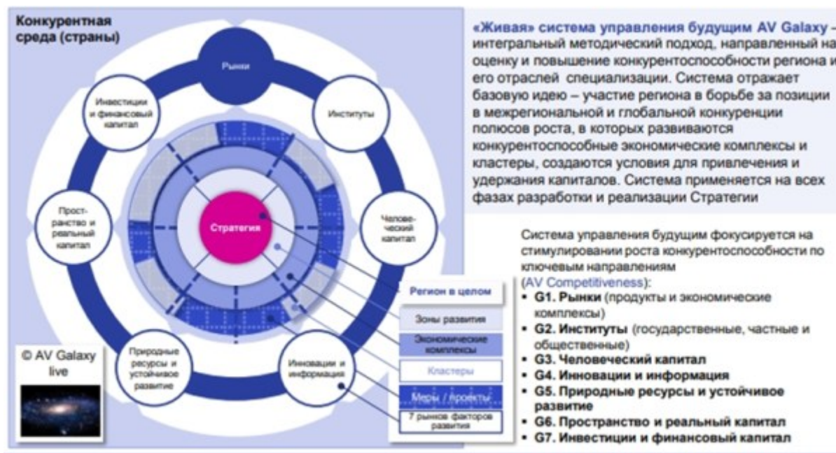
Рис. 3. «Живая» система управления будущим AV Galaxy — методическая база Стратегии [11, 14]