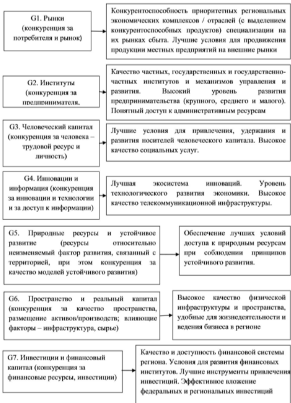
Рис. 5. Цели семи направлений конкуренции регионов, хозяйствующих субъектов в стратегическом развитии Краснодарского края

На наш взгляд, необходимо сгруппировать типы развития муниципальных образований Краснодарского края в виде матрицы, что способствует выявлению уровня развития, а также цифровизации экономики региона (табл. 6).