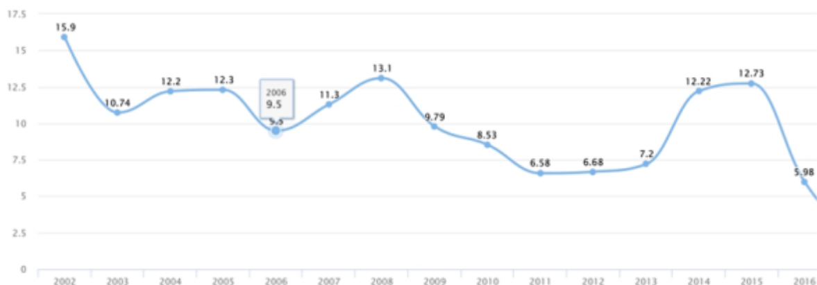
Рис. 2. Годовой график инфляции в Краснодарском крае с 2002–2017 г.