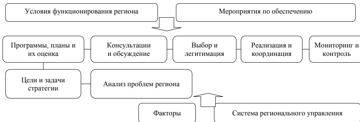
Рис. 4. Этапы и порядок реализации стратегии регулирования рыночной среды в Краснодарском крае

Разработка Стратегии развития Краснодарского края на долгосрочную перспективу, на наш взгляд, должна включать следующие этапы и порядок их реализации в регулировании рыночной среды Краснодарского края (рис. 4).