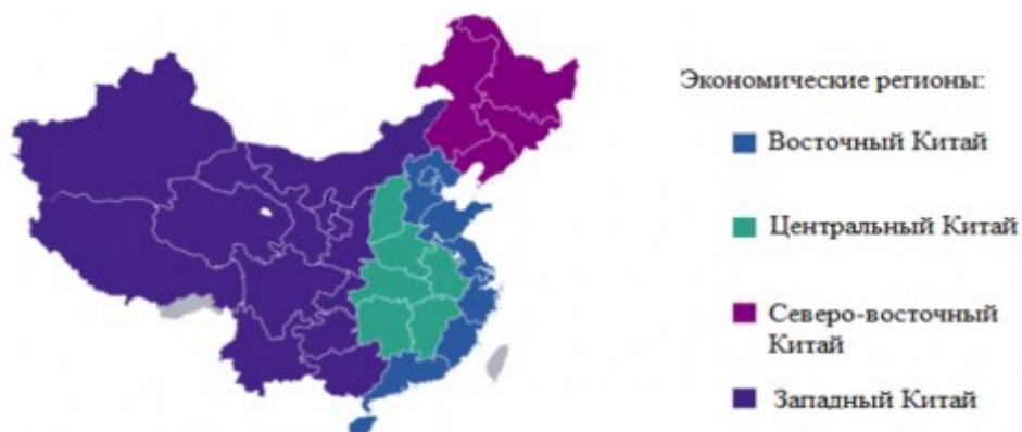
Рис. 1. Экономические регионы КНР [10].

Западное экономическое пространство включает в себя крупнейший регион Китая. Регион состоит из шести провинций: Сычуань (四川), Гуйчжоу (贵州), Юньнань (云南), Шеньси (陕西), Ганьсу (甘肃) и Цинхай (青海); три автономных района: Синьцзян-Уйгурский автономный район (新疆维吾尔自治区), Нинся-Хуэйский автономный округ (宁夏回族自治区) и Тибетский автономный район (西藏自治区); и один город центрального подчинения: Чунцин (重庆). Общая площадь региона – 6,8 млн кв. км., составляет 71 % общей площади страны [6].