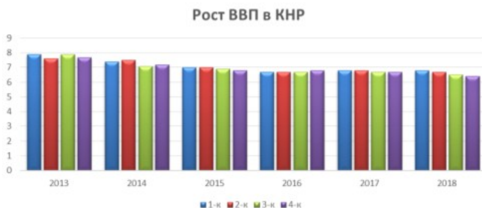
Рис. 2. Рост ВВП в КНР [4].

Каждый регион занимает свое место в экономическом развитии Китая. На рисунке ниже показан рост ВВП Китая за последние годы.