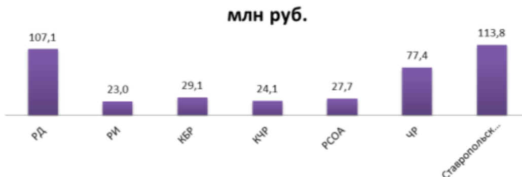
Рис. 1. Доходы консолидированных бюджетов в 2017 г. республик СКФО

Сбалансированность территориального и отраслевого развития является важной составляющей в региональной бюджетной политике. При этом распределение финансов между регионами осуществляется при условии огромной разницы в финансовом состоянии регионов. В одном ряду стоят регионы, осуществляющие перечисление в бюджет страны более 50 процентов своих доходов, и регионы, у которых бюджет в большей части сформирован из средств федерального бюджета. К таким регионам относятся субъекты СКФО за исключением Ставропольского края. Доходы консолидированных бюджетов в 2017 г. республик СКФО выглядели следующим образом (см. рис. 1) [19, с. 971]: